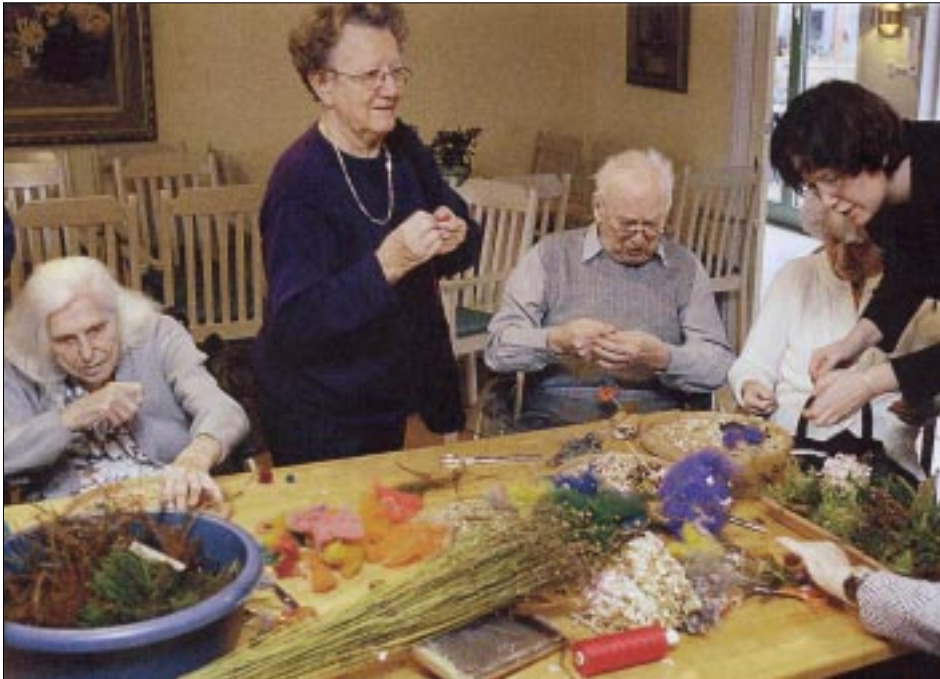
Upplivedag på äldreboendet Norrelid i Växjö.