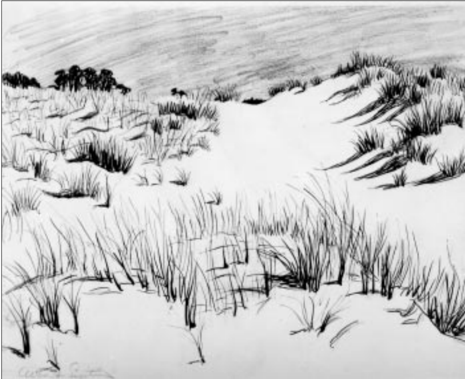
Sanddyner. Albert Engström (1869-1940).