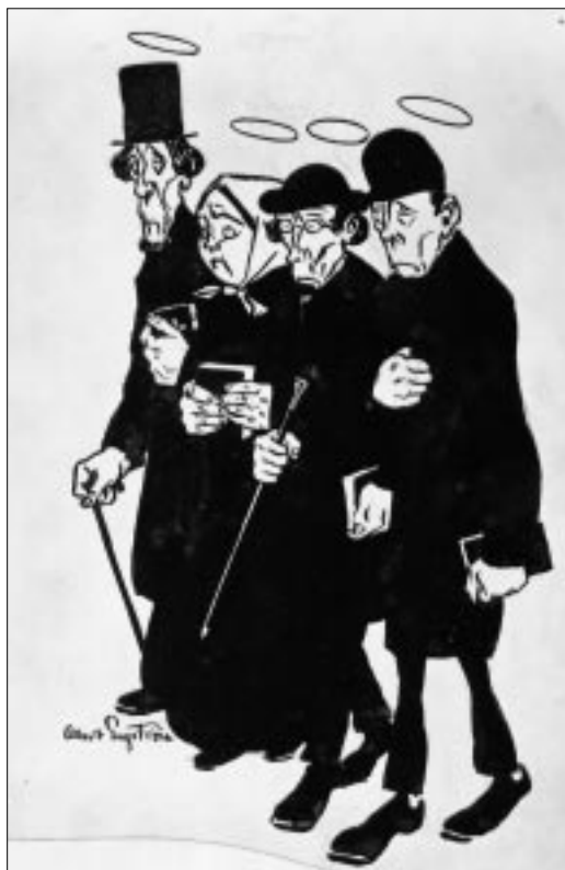
Tre gubbar och en gumma, 1900. Albert Engström (1869-1940).

Mitt uppdrag är att uppmuntra, inspirera och stimulera dagens personal inom vården till att våga förändra i det dagliga arbetet. Utifrån frågan "Vad är kultur" närmar jag mig denna uppgift. Det jag kommit fram till är att målet för kultur måste vara omvårdnad, utformad efter patienternas behov och intresse med en helhetssyn på människan. Går kultur och vård att förena och vad menas egentli-