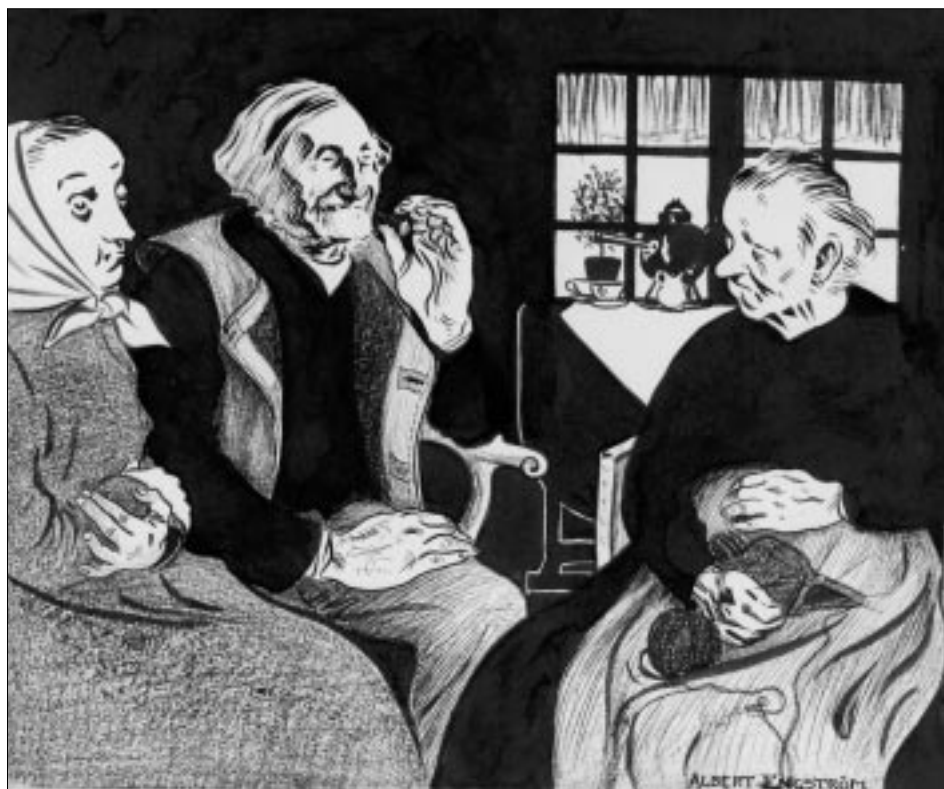
Teckning med gamla. Strix 1901. Penna, svart bläck och krita. Albert Engström (1869-1940).